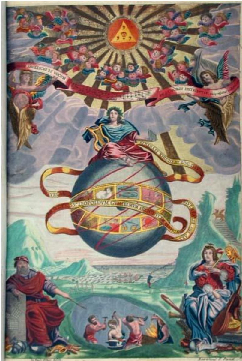
Voorpagina van Athanasius Kirchers Musurgia Universalis met Canon inscriptie